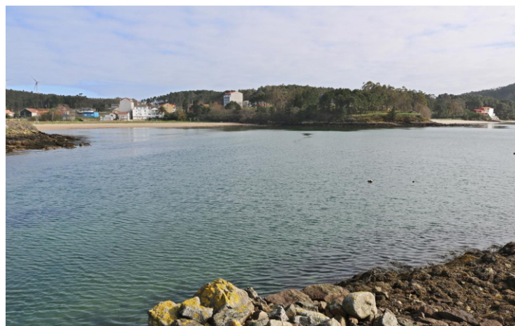
Punta dos Castros