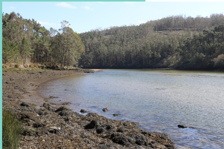
Furna do Sapo