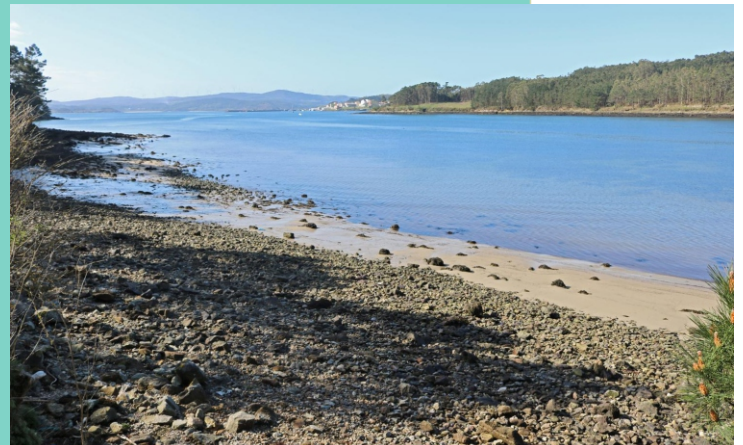
Enseada da Basa