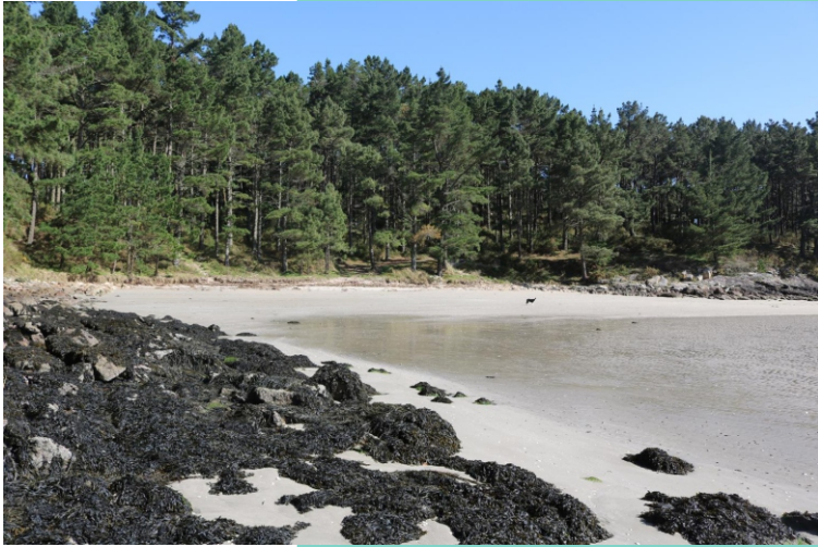
Praia do Reo dos Coiros