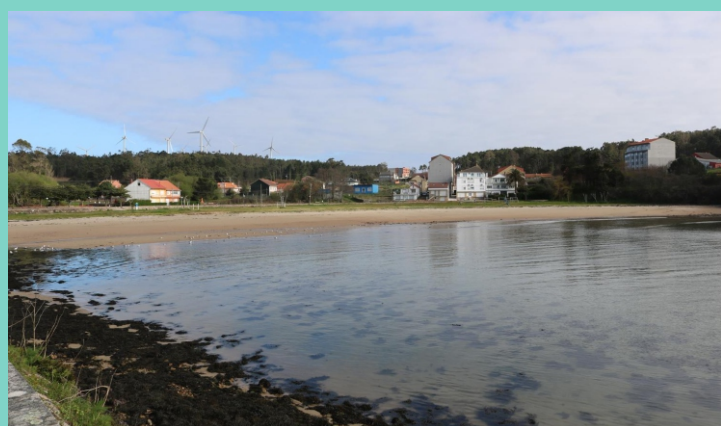
Praia Area da Vila