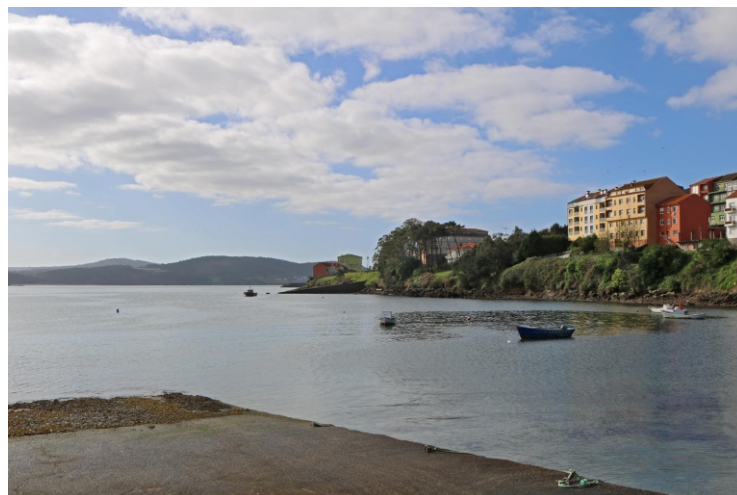
Punta da Ínsua

En Camariñas hai unha importante actividade de "palilleiras", fonte de recursos e atractivo desta zona. Hai un museo do encaixe e obradoiros para formar á xente moza.