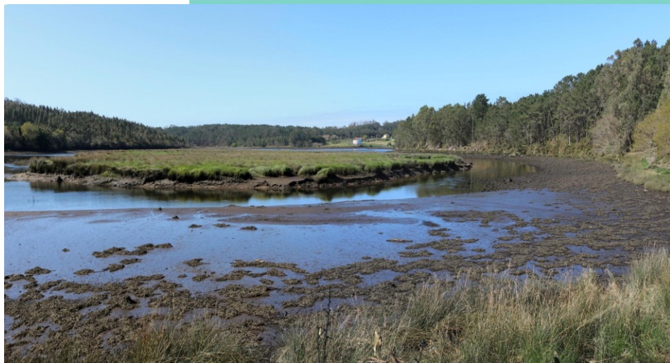
Illa do Forno do Sapo