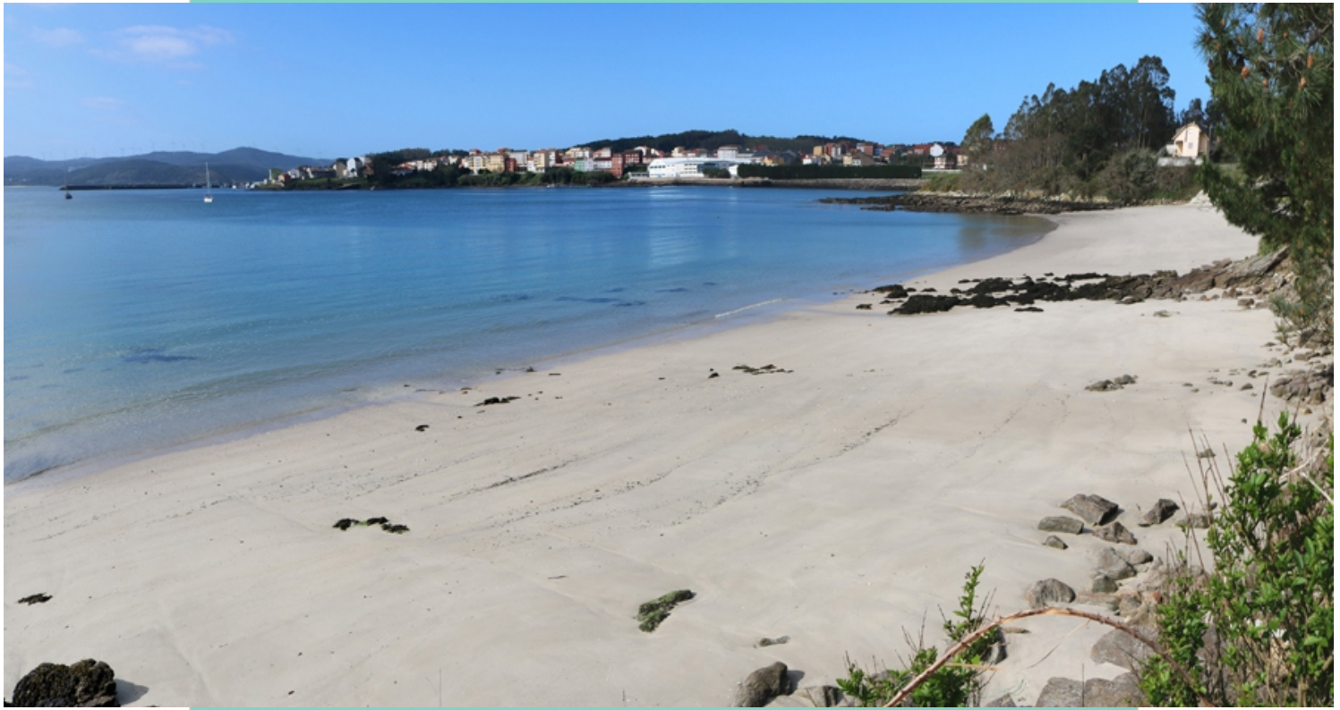
Praia de Lingude, con Camariñas ao fondo