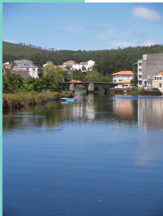
Ponte do Porto