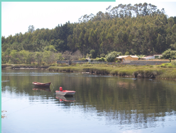
Esteiro do rio Grande ou do Porto