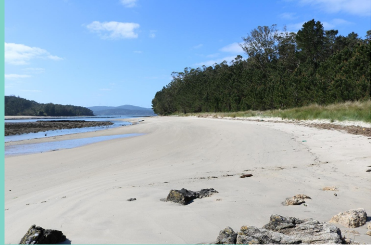
Praia do Ariño