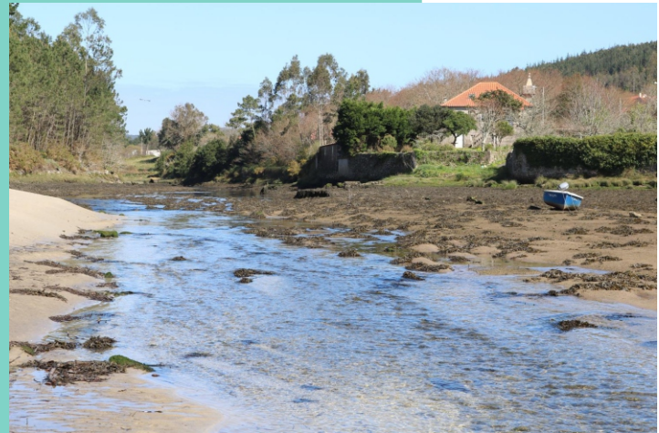
Rego de Lamastredo