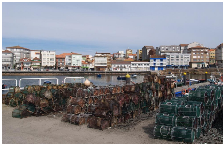
Vista do porto e vila de Camariñas.