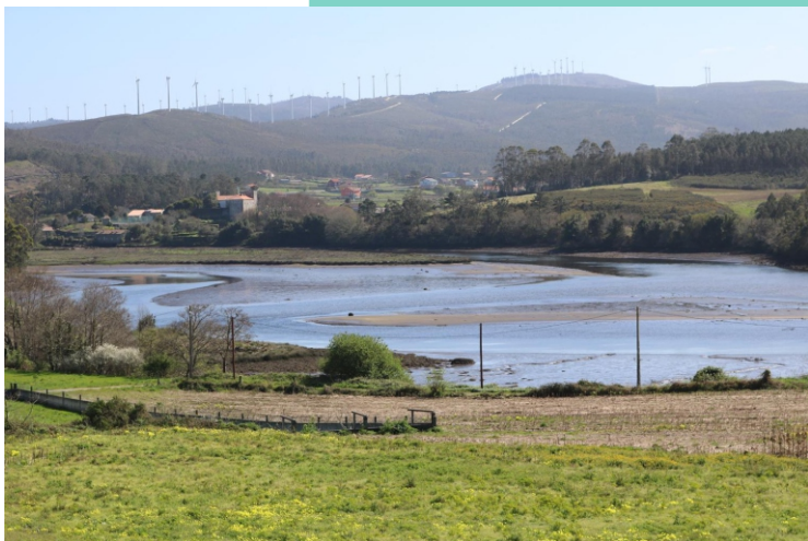
65-Baixo de Dor