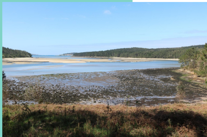
Ría de Camariñas desde A Man do Medio