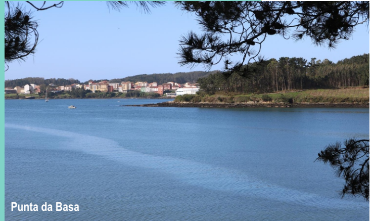
Punta da Basa